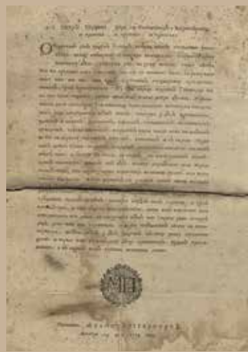
Указ Петра Первого 1714 г.